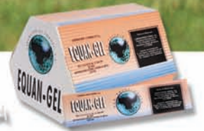
** EQUAN-GEL DESPARASITANTE Reg. SAGARPA No. Q-1069-099

Laboratorios Tornel, S.A. Tel. 2122 4700 Fax 2122 4704 Internet www.tornel.com e-mail: ventas@tornel.com Global: info@tornel.com