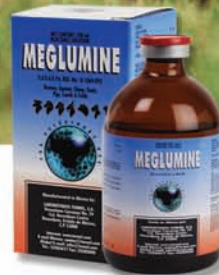
** MEGLUMINE ANTIINFLAMATORIO NO ESTEROIDAL Reg. SAGARPA No. Q-1069-093