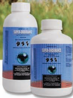
* SUPER ENDURANCE COMPLEMENTO ALIMENTICIO Reg. SAGARPA No. Q-1069-100