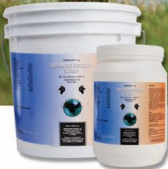
* ARTI-PROTECT REFORZADO EQUINOS CONDROPROTECTOR Reg. SAGARPA No. Q-1069-112

* De uso Veterinario. ** De uso exclusivo Veterinario. Su venta requiere receta médica.