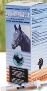
* EQUI-OMPRAZOLE INHIBIDOR DEL ÁCIDO GÁSTRICO Reg. SAGARPA No. Q-1069-103